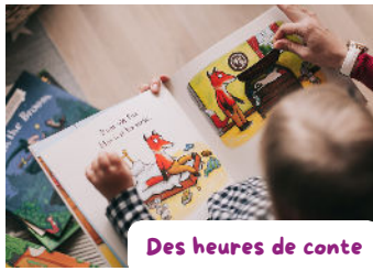
Des heures de conte