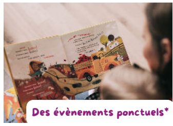
Des événements ponctuels*