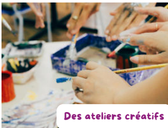
Des ateliers créatifs