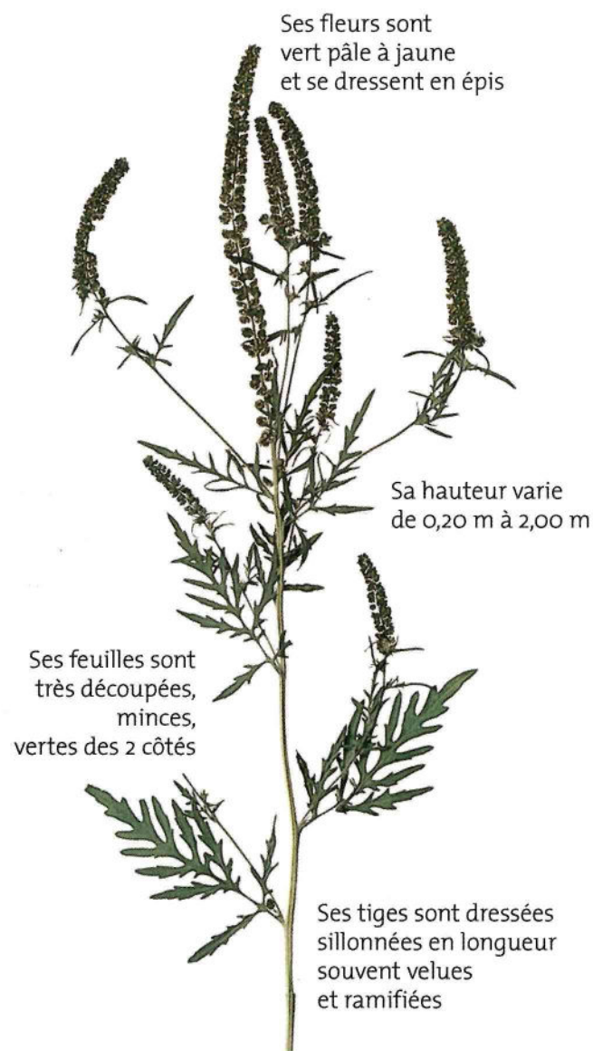
AMBROISIE EN FLEUR