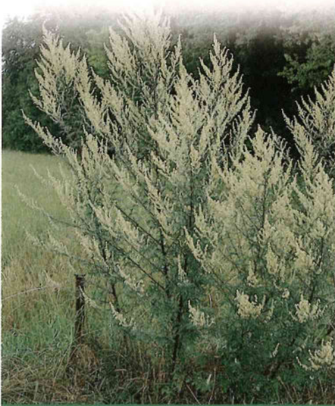
ARMOISE VULGAIRE EN FLEUR

Observatoire des ambrosies, d'après DDAS Rhône