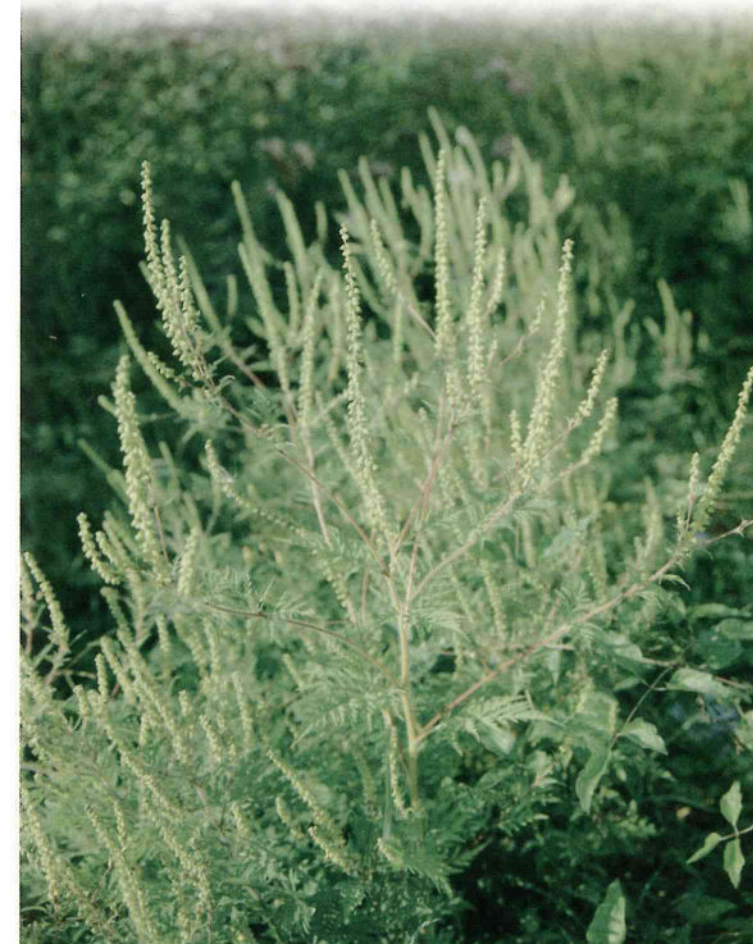
AMBROISIE A FEUILLES D'ARMOISE