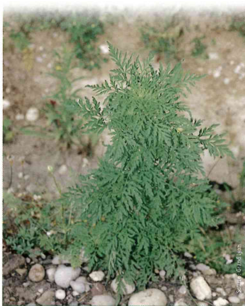
L'AMBROISIE AVANT FLORAISON